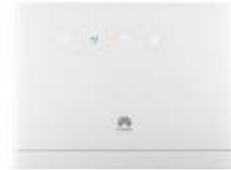
Vodafone R218z Wifi 4G HotSpot Huawei B315 4G Router