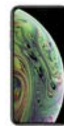
Apple iPhone 7 32 GB