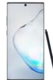
Huawei P30 Pro (256 GB)